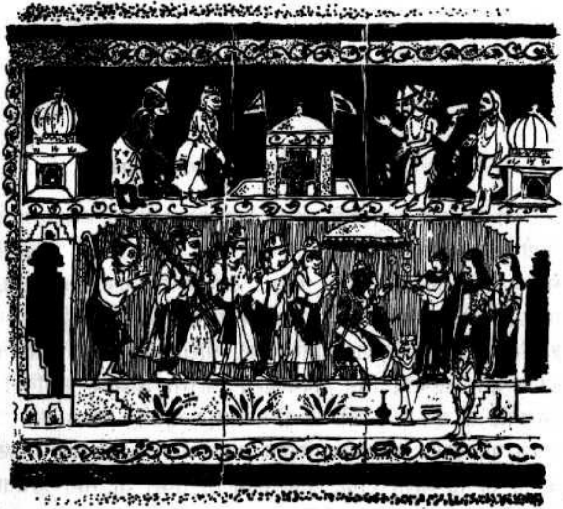
राज्याभिषेक व स्वर्गातून पुष्पवृष्टि (माळवा शैली—सतरावे शतक) राष्ट्रीय संग्रहालय, नवी दिल्ली